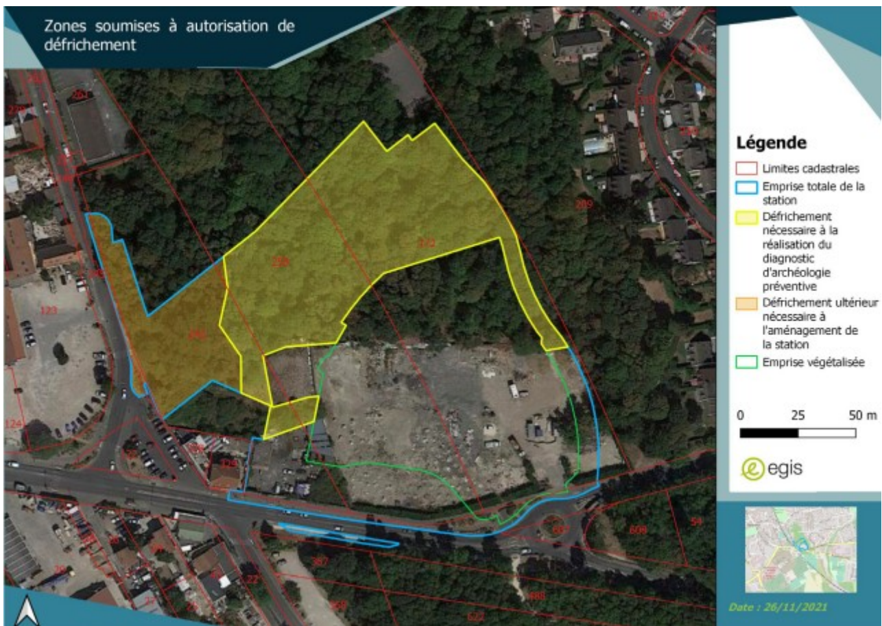
Cartographie de la zone dont le défrichement est autorisé.